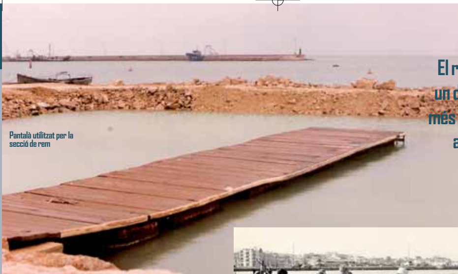
Pantala utilitzat per la secció de rem

El rem ha estat un dels esports més guardonats a nivell local