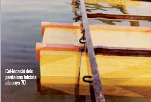
Col·locació dels pantalans inicials als anys 70