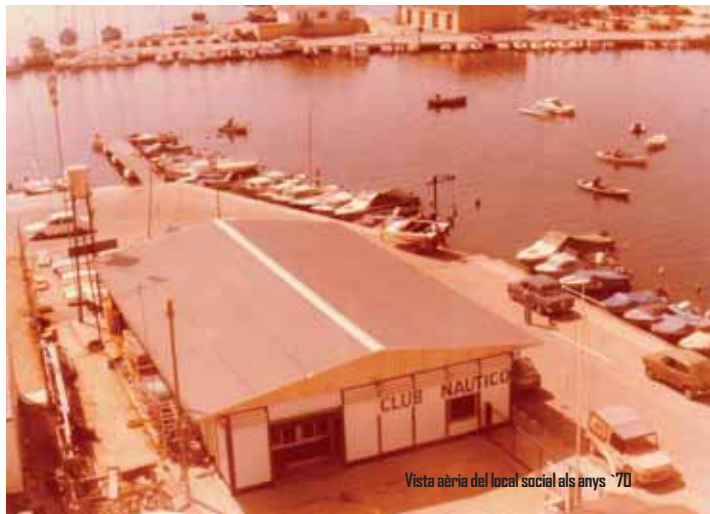
Vista aèria del local social als anys '70