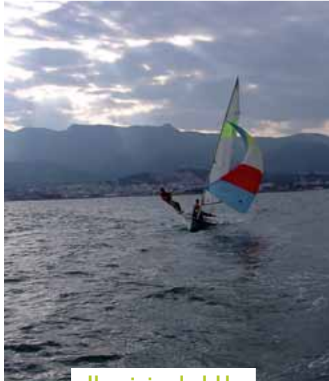
Un goig incalculable