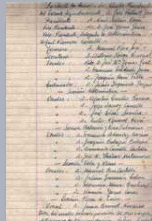
Pàg. 8 del llibre d'actes

En un d'altre apartat d'infraestructures cal assenyalar que, després de la problemàtica aluminosi detectada l'any 2002, l'any 2007 els