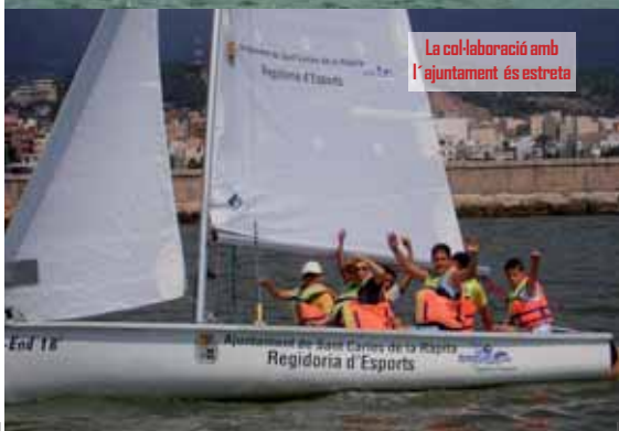
La col·laboració amb l'ajuntament és estreta