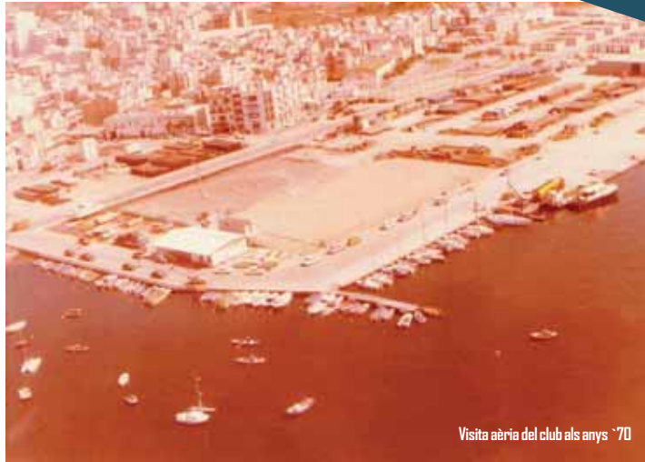
Visita aèria del club als anys '70