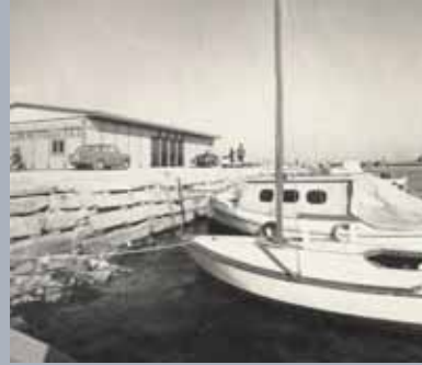
Millors d'atracament a la pròpia zona del local social