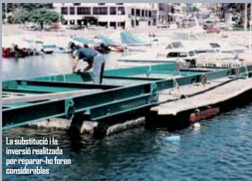
La substitució i la inversió realitzada per reparar-ho foren considerables

pantalans foren completament reparats, col·locant-se a més cobertes de fusta tractades convenientment. Un any abans, l'any 2006, es van quitrinar tot els voltants del club, instal·lant-se tanques i adequant-se també la zona de pàrquing, que es gratuïta per als socis, a diferència de molts d'altres clubs on hi ha un abonament especial per aquesta circumstància. També, en aquesta línia de modernització, des de l'any passat hi ha un sistema de vigilància de tot el club a temps real. Hi ha 5 càmeres que poden donar imatges de la nostra embarcació des de qualsevol part del món a través d'Internet, la qual cosa crea un sentit d'apropament de molts socis.