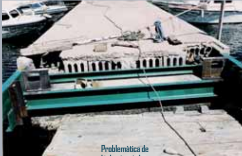
Problemàtica de l'aluminosi als pantalans del club l'any 2002