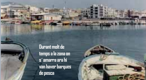
Durant molt de temps a la zona on s'amarra ara hi van haver barques de pesca