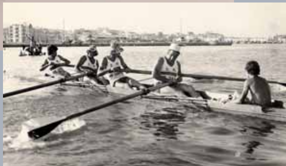
Remers del club entrenant en aigües del moll

Totes aquestes coses han fet sens dubte que a dia d'avui en parlar del Club Nàutic Sant Carles de la Ràpita ho fèssim amb la consciència de trobar-nos davant d'un club modern, funcional i que treballa durament pels seus socis. Probablement, per tot això, podríem dir, sense por a equivocar-nos, que "lo Nàutic de la Ràpita" és la entitat esportiva més important de la ciutat.