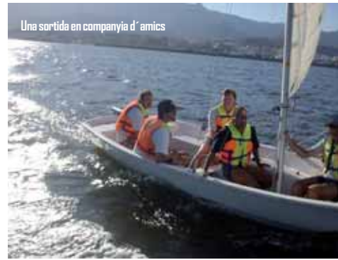
Una sortida en companyia d'amics

Ens hem format en vela adaptada i acollim grups de discapacitats físics i psíquics. Som una de les escoles de vela més importants en aquesta modalitat.