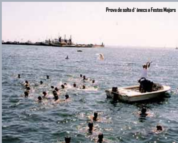
Prova de solta d'ànecs a Festes Majors