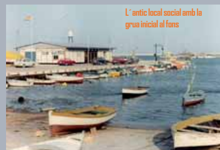
L'antic local social amb la grua inicial al fons