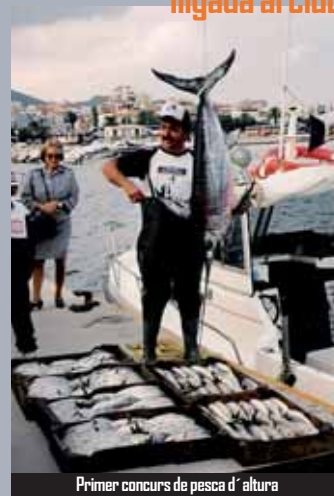
Primer concurs de pesca d'altura