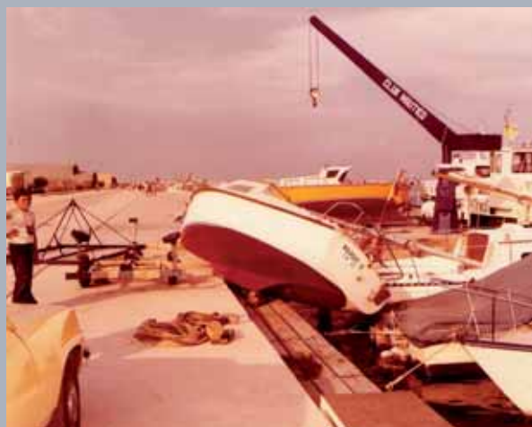
Avària produïda per un helicòpter a un embarcació del club als anys 70