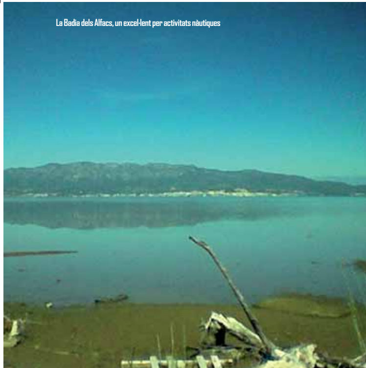
La Badia dels Alfacs, un excel·lent per activitats nàutiques

Disposem de 6 velers-escola, 4 de la classe "Ra-