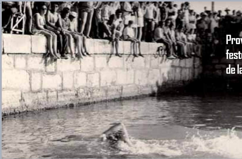
Proves de natació a festes majors al costat de la Campsa