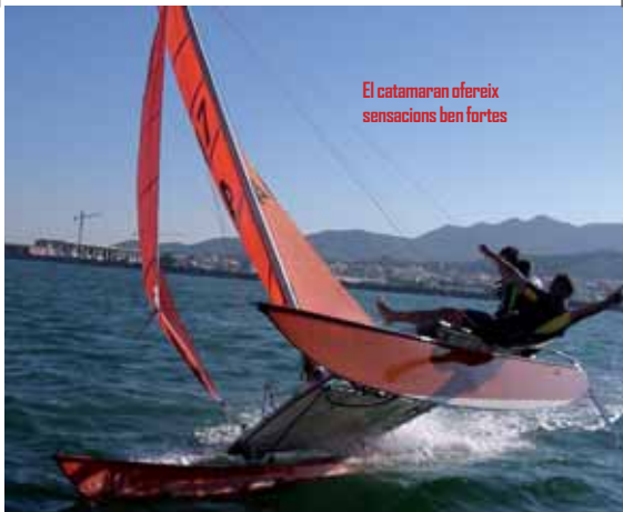
El catamaran ofereix sensacions ben fortes